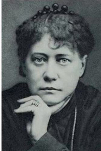
Helena Petronila Blavatsky

cumplido en otros y otros países, y aún hoy esta extraña ley continúa cumpliéndose. Por último, ¿después de haber conocido estos hermanos la Gnosis, apartados de ella, han podido seguir una vida normal?