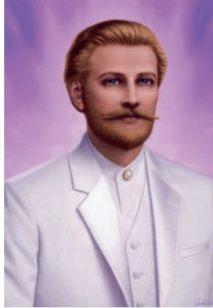
El Conde Saint Germain