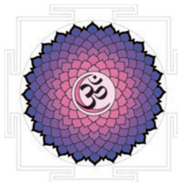
Sahasrâra ( Iglesia de Laodicea )

Cuando Kundalini llega a la altura de la glándula Pineal se abre la Iglesia de Laodicea . Esta flor de loto tiene mil pétalos resplandecientes. La glándula pineal está influenciada por Neptuno. Cuando se abre esta Iglesia recibimos la polividencia, la intuición, etc. La pineal se haya relacionada íntimamente con los chacras de las gónadas o glándulas sexuales. A mayor grado de potencia sexual, mayor grado de desarrollo de la glándula pineal. A menor grado de potencia sexual, menor grado de desarrollo de la glándula pineal. Urano en nuestros órganos sexuales y Neptuno en la glándula Pineal se unen para llevarnos a la realización total.