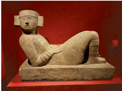
Escultura Chac Mool Maya, expuesta en el Museo Nacional de Antropología de México.

El aspirante en esta posición se imaginará que la energía del sol penetra por su plexo solar haciendo vibrar y rotar de izquierda a derecha como las manecillas de un reloj cuando lo miramos de frente. Este ejercicio puede hacerse una hora diaria. El mantram básico de este centro magnético es la vocal U. Esta vocal se puede vocalizar alargando el sonido así: UUUUUUUU. Un plexo solar bien despierto anima a todos los chacras del organismo maravillosamente. Así nos preparamos para la Iniciación.